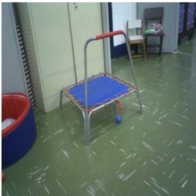
Anexo 2.1: Pula Pula. A criança poderá ter uma orientação e mobilidade melhor durante as atividades realizadas neste brinquedo.