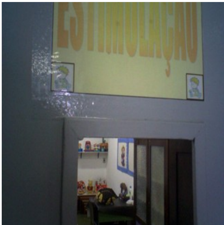
Anexo 1: Sala de Estimulação Precoce. Este lugar faz parte da composição de três salas destinada a atividades com essas crianças.