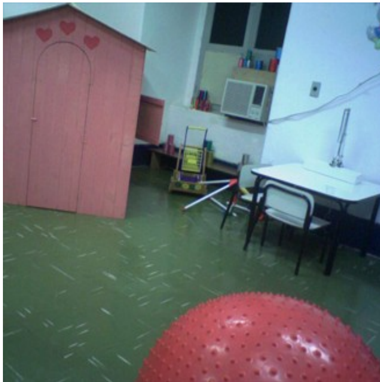
Anexo 2.2: A bola de estimulação sensorial e a casinha. Ambas ajudam na orientação, mobilidade e, por conseguinte, na Psicomotricidade da criança.