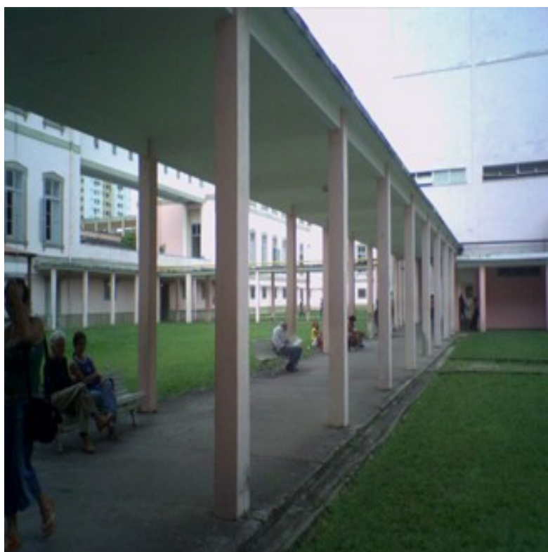
Anexo 3: O instituto Benjamin Constant. A interação e o contato social são bastante evidentes.